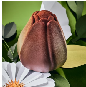
06 COLLECTION DE PÂQUES