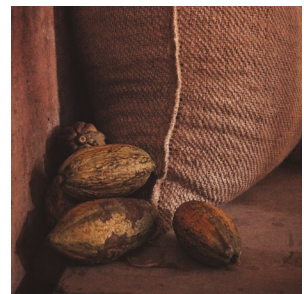
56 VALEURS & ENGAGEMENTS