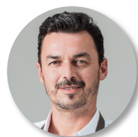
PAR THIBAUD ROUILLARD Chef Exécutif à Roland-Garros